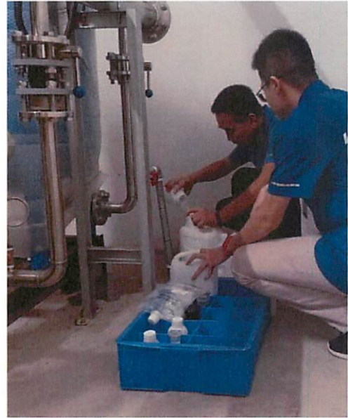
图 2：雅景豪庭采样口