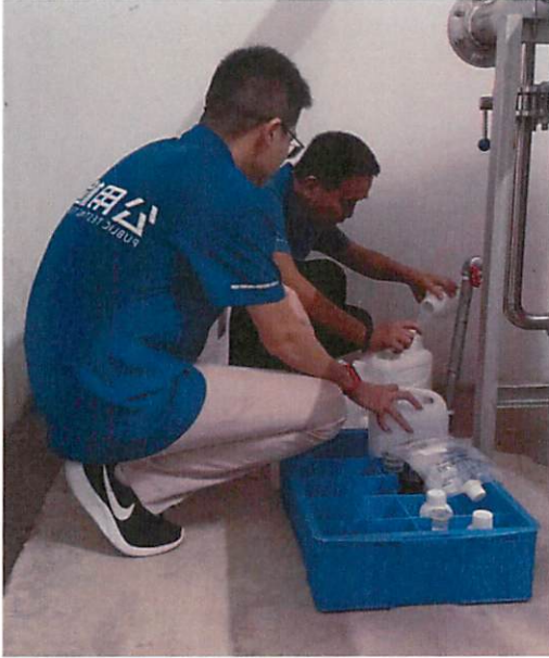
图 1：雅景豪庭采样口