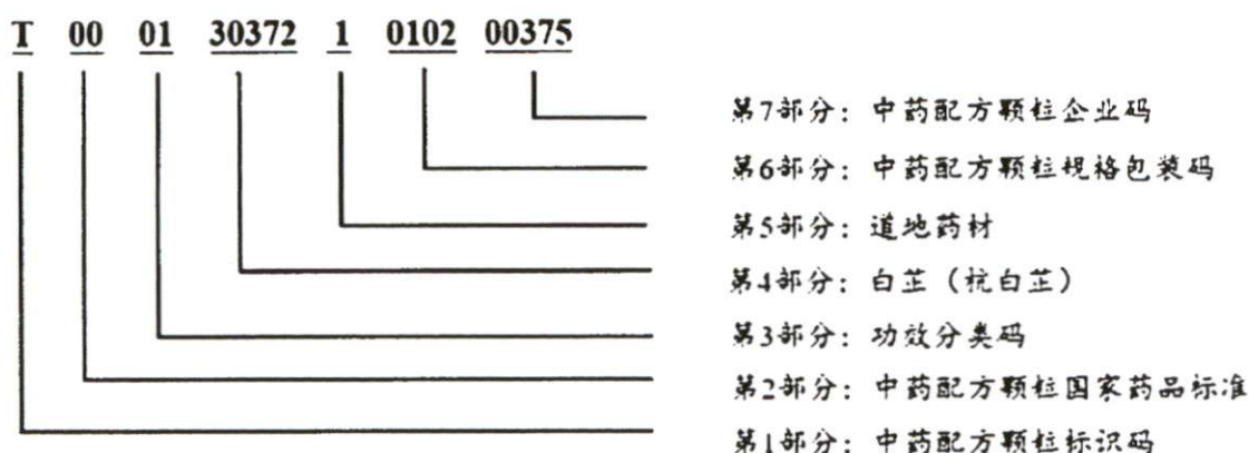
图 2：中药配方颗粒编码示例

第 1 部分：中药配方颗粒标识码，统一使用中药饮片标识码，用 1 位大写英文字母“T”表示（类似西药 X、中药 Z 的类别标识）。