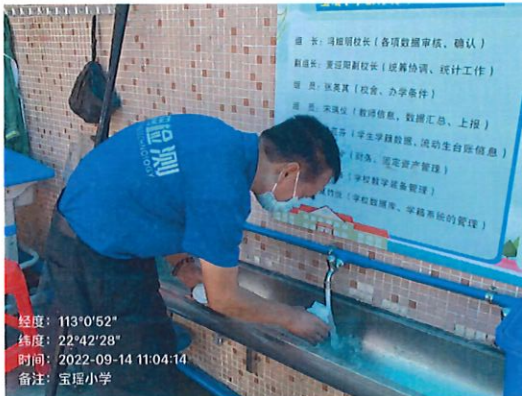
雅瑶宝瑶小学 (雅瑶镇) 采样口