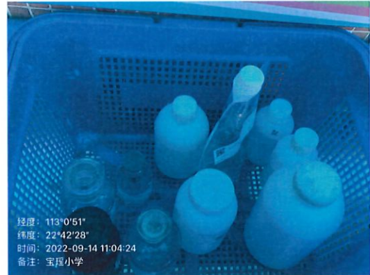
雅瑶宝瑶小学 (雅瑶镇) 水样