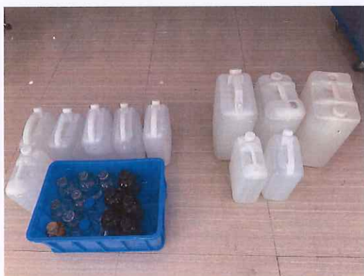
鹤山北控水务第三水厂出厂水样品