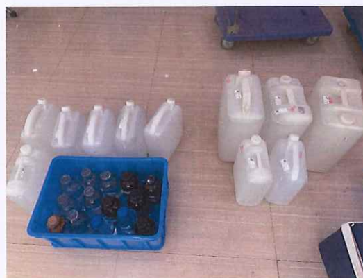
鹤山北控水务第三水厂出厂水样品